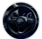
Mandos al volante