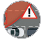
Asistente de cambio de carril (LDA)