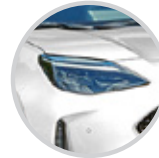
Faros multi LED con luces de circulación diurna