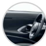
Texturas interiores que destacan