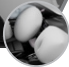
8 Airbags distribuidos en todo el vehículo