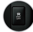
Control de tracción y estabilidad