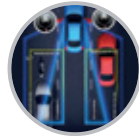
Sensor de punto ciego (BSM)