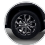
Aros de aleación de lujo de 17