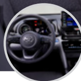
Diseño interior con sensación HIGH TECH

Cuenta con un espacio de carga de 401 litros. Además, ofrece múltiples compartimentos para guardar objetos a lo largo de la cabina.