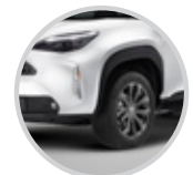
Gran altura al piso, propio de un SUV