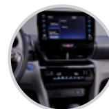
Radio touch con conectividad Android Auto y Apple Car Play