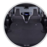
Espacio eficiente en cajuela de 401L