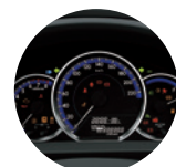
Pantalla Multi-información (versión AT)

Cuenta con vidrios eléctricos con protección contra atascamiento para el conductor y cierre centralizado.