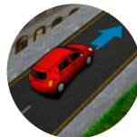
Asistente de arranque en pendientes (HAC)