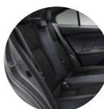
Asientos de tela de alta calidad