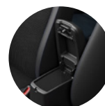
Amplios espacios de almacenamiento