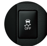
Control de Tracción (TRC) y control de Estabilidad (VSC)