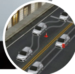
Frenos ABS con EBD y BA

Cuenta con bolsas de aire frontales con sensores que miden la fuerza y ubicación del impacto para activarlas de manera efectiva.