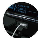
Radio con pantalla táctil de 7" con CarPlay / Android Auto y 4 parlantes